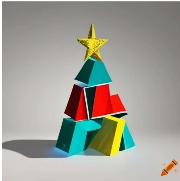
Obr. 4 Obrázek vygenerovaný Craiyon

Obrázek citujeme podobně jako text, v tomto případě tedy takto: